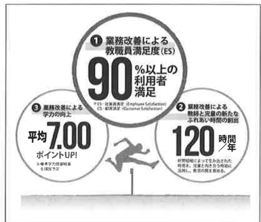
市が掲げる達成指標 (西条市)

訂正 三月号において、三面「ふるさとに生きる」の欄で、「昭和三十五年」を「昭和二十五年」と誤記したことをお詫びし、訂正いたします。