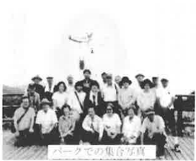
パークでの集合写真

八月は佐田岬半島を中心 に長浜や保内などを巡りました が、台風五号の影響もあり、予 定を変更しながら実施しまし た。十一月には、周桑、今治方 面へ出かけ、鈍川溪谷やタオ ル美術館などへ行きました。 今後も、多くの活動を通じ て、会員の皆様が一体となり 交流や心のつながりが深まる 教育会を目指していきたいと 思います。