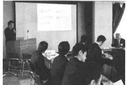
成果報告会の様子 (H30.2)

今年度、県教育委員会では、外部人材の活用として、スクール・サポート・スタッフや部活動指導員の配置、スクールロイヤーの導入を予定しています。また、教職員業務改善モデル事業は、新たにモデル地域を追加して実施する予定です。学校の業務改善は、国や教育委員会が取組を推進しなければ効果を発揮しない内容も多くありますが、教職員一人一人の時間意識も重要とされており、教職員の意識改革も併せて進める必要があります。