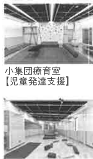
小集団療育室 【児童発達支援】

四国中央市に、昨年四月開設された「子ども若者発達支援センター」は通称「Palatte (パレット)」といいます。この施設は、「子ども若者支援推進法」に基づき、一歳から三十九歳までの子どもや大人を対象とした総合相談支援センターです。 施設には、相談室のほか、「感覚統合療法室」や「個別療教室」「小集団療教室」も