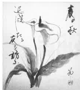
俳画・水墨画教室 西島 節子 作

げていけたらいいなと思います。」 財源を確保していくため、私たちにできることを模索しています。アイデアがあれば教えていただきたいと思