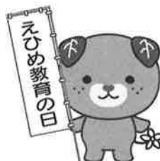
愛媛県イメージアップ キャラクター みきゃん

公益財団法人 日本教育公務員弘済会愛媛支部 〒790-8545 愛媛県松山市宮町1-5-33 エスワールド愛媛文教会館内 TEL(089)932-8358 FAX(089)932-8357