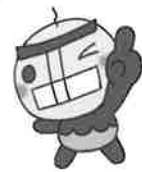
西予市のゆるキャラ せい坊