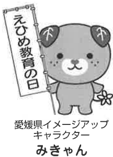
愛媛県イメージアップキャラクター みきゃん